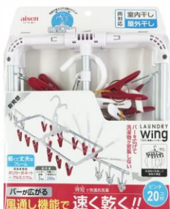
LS005 ウィングアルミ風通しハンガー 20ピンチ R