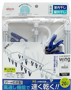
LS005 ウィングアルミ風通しハンガー 20ピンチ