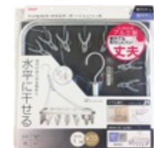
LK601 軽量アルミハンガー-20P