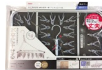
LK602 軽量アルミハンガー-32P