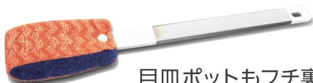
目皿ポットもフチ裏も

GP035 サイズ：約350×50×30mm 材質：ブラシ部 ナイロン不織布・ポリエステル(フッ素樹脂加工) ハンドル部 ステンレス・ポリプロピレン 入数：20個/ケース 上代：800円(税抜)/個 生産地：日本