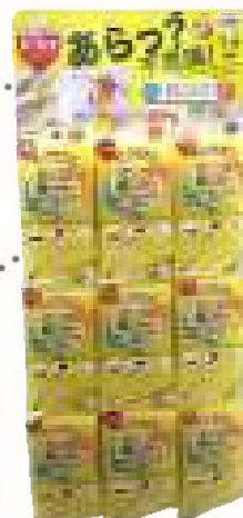
SW バススポンジ バス9付台紙