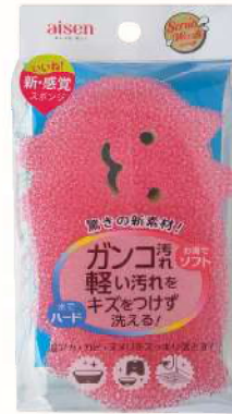
BSW02 SWバススポンジネコ