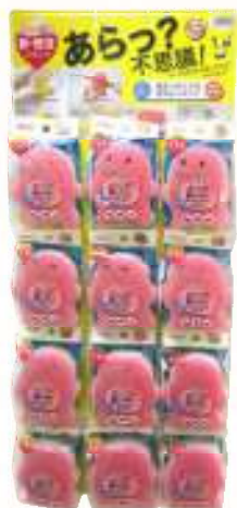
SW キッチンスポンジおばけ 12付台紙