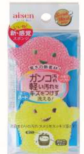
BSW03 SW洗面スポンジおばけ2P