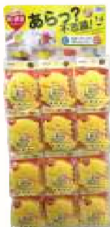
SW キッチンスポンジかいじゅう 12付台紙