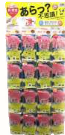
SW 洗面スポンジおばけ 2P 16付台紙