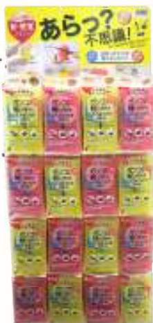
SW キッチンスポンジ 16付台紙