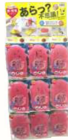
SW バススポンジネコ バス9付台紙