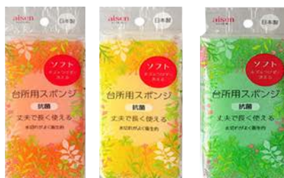
KSA01 台所用スポンジソフト