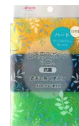
KSA02 台所用スポンジ ハード 3 個組