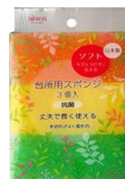
KSA01 台所用スポンジ ソフト 3 個組