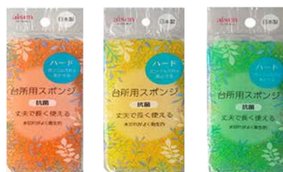
KSA02 台所用スポンジハード