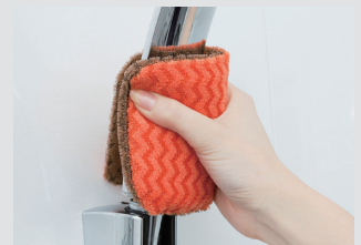
薄型で折り曲げ易い!