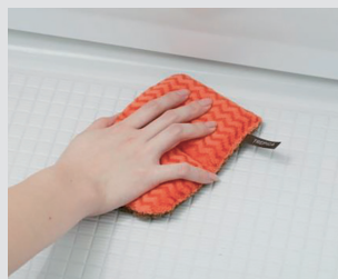
バスルーム凹凸床