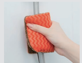
シャワーホース(風呂栓チェーン)